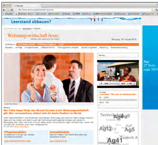
Beilagen auf der Homepage „Wohnungswirtschaft heute“

Nachhaltig werben mit dem Mehrfachnutzen, schalten Sie Ihre Beilage auf der Homepage www.wohnungswirtschaft-heute.de , in den PDF-Fachmagazinen „Wohnungswirtschaft heute“ und „Wohnungswirtschaft heute. TECHNIK“. Wir brauchen nur Ihre Beihefter als PDF, wenn Sie wollen mit Video oder Verlinkung. Sparen Sie sich die gedruckten Papiervorlagen.