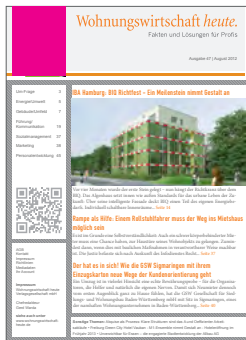
Kopfanzeige im Titel

Anzeigenschaltung PDF-Fachmagazine: Hier präsentieren Sie Ihr Unternehmen wie in einem gedruckten Fachmagazin. Ihre Anzeigen bleiben bestehen – in heruntergeladener Form auf den Rechnern der Leser und in der Lösungsdatenbank der „Wohnungswirtschaft heute“, die jederzeit mit allen Suchmaschinen verlinkt bleibt.