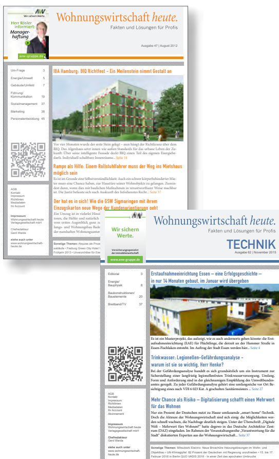
Beilagen im PDF-Fachmagazin „Wohnungswirtschaft heute“ und „Wohnungswirtschaft heute. TECHNIK“

Die Titelseite Ihrer Beilage zeigen wir auf der Homepage. Überschrift und ein kurzer Anriss erklären den Inhalt, per Klick kann der Kunde sie runterladen, solange wie Sie den Platz gebucht haben. Überschrift und Anriss werden auch von den Suchmaschinen gelesen, Ihre Beilage landet somit nicht im Papierkorb, sondern ist jederzeit im Internet für Entscheider abrufbar.